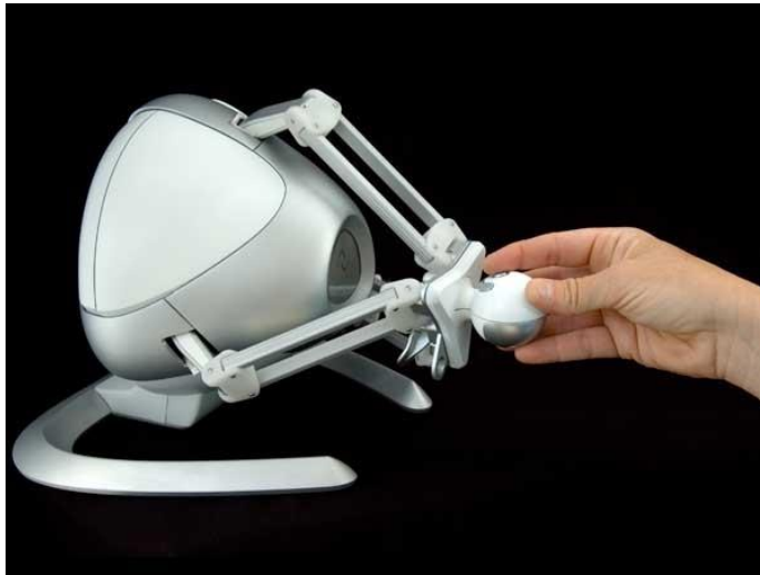
شكل جهاز Novint Falcon

- شجع امناء المتاحف في اوائل القرن الحديث على التفاعل متعدد الحواس مع المعروضات - لذا تم تطوير التقنيات التي ستسمح لنا بخلق تجارب متعددة الحواس في المتاحف والمعارض والفكرة العامة هي انتاج نماذج رقمية تشمل الخصائص المتعدده للمعروضات مثل ( الشكل والصوت والرائحة والمذاق والشعور) مما يعزز التجربة المتحفيه ويزيد من التفاعل بين الزائر والعرض المتحفي