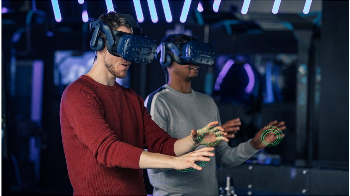
شكل يوضح التعرف على الاشكال من خلال زواياه وحدوده وانحناءاته

- التعرف على الاشكال Recognition : ويعتمد هذا النوع على أساس التعرف على الشكل من خلال زواياه وحدوده وانحناءاته مثال ذلك تحديد معالم الوجه وذلك من اجل زيادة تفاصيل هذا الوجه بحيث يمكن استرجاع هذه التفاصيل ودراستها فيما بعد.