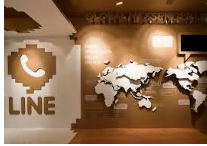
شكل يوضح تصميم المعلومات و البيانات من خلال مجسمات ثلاثية الابعاد

- و ذلك عن طريق اعطاء تصميم الانفوجرافيك بعد ثالث ويكون التصميم مجسما باستخدام الخامات و الادوات و تطبيقاتها بارتفاعات و ابعاد تساعد علي ايضاح التصميم و ايصال الفكرة حيث يصبح المستخدم قادرا على إدراك المعلومات من خلال مجسمات حقيقية.