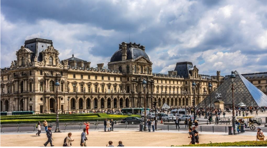
متحف اللوفر – باريس

- يوجد العديد من اساليب تصنيف مباني المتاحف في القرن العشرين وذلك طبقا للعديد من