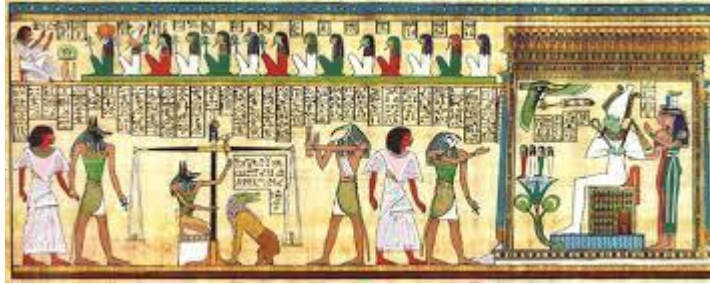
شكل يوضح رسوم الحضارة الفرعونية