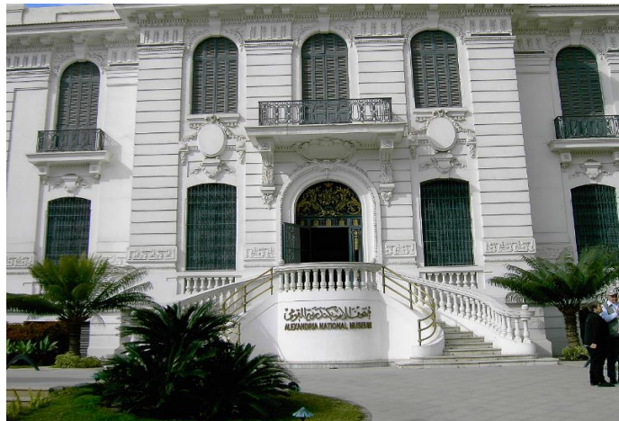
شكل يوضح المتحف القومي بالاسكندريه

(التقنيات الحديثة بين العمارة الداخلية و متاحف السرد العرض المتحفي) د. نرمين فارس