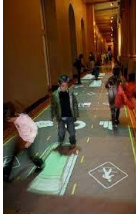
شكل يوضح نماذج للعرض الضوئي المباشر داخل المتاحف

- يتم العرض الضوئي للمعلومات من خلال أجهزة العرض التي تعكس الضوء على الاسطح المختلفة ( الاسطح الزجاجية) حوائط، أرضيات أو أسقف - ويختلف تصنيف أجهزة العروض الضوئية حسب مسار الضوء - وتنقسم هذه الاجهزة عموماً الى عدة أنظمة للعرض حسب الطريق الذي يسلكه الضوء في الجهاز الذي الي ان يسقط على شاشة العرض