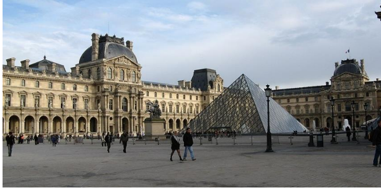
متحف اللوفر في باريس

1- متحف اللوفر :- لا يظهر المتحف الأكثر زيارة في العالم علامات الانحراف ؛ بقيت أرقامها قوية عند 8.5 مليون لعدة سنوات حتى الآن. في حين أن متحف اللوفر هو في الواقع الجنة وعاشق الفن البالغ عددهم حوالي 35,000 روائع، بما في ذلك تمثال فينوس دي ميلو و الموناليزا ، بل هو أيضا موضع جدل، وليس الجميع تقدر الهرم الزجاجي 69 أقدام عالية IM بي، تضاف إلى متحف المدخل عام 1989.