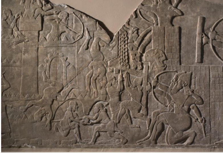
نقوش القصر الاشورية

- الغالبية تصور شخصيات واقية سحرية ، مثل الجينات المجنحة ، التي تحمي الملك من القوى الخارقة للطبيعة الضارة. كما تم تزيين بعض غرف القصر بمشاهد سردية- تشمل الموضوعات الرئيسية المطاردة الدولة