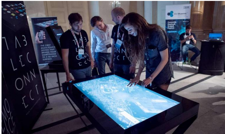
شكل يوضح منصة ذكية في معرض نقطة انطلاق الاتصال بالفن المعاصر بمتحف الفن الحديث بسان فرانسيسكو Contemporary Art, San Francisco Museum of Modern Art

- حيث صممت هذه التطبيقات بشكل يسمح بتجهيز الهاتف الذكي بالعديد من الخدمات والوظائف التي تنفذ في البيئة المادية لترويج المنتج وإمكانية تحديد الموقع للمستخدم والمعدة خصيصاً GPS والشاشات التي تعمل باللمس " screens Touch".