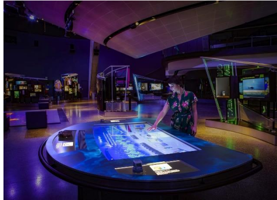
شكل يوضح النماذج و المجسمات ثلاثية الابعاد لتقدم المعلومات للزوار من خلال عملية تفاعلية

هى واحدة من التقنيات التي احدثت طفرة كبيرة فى عالم الاتصال عن طريق إستخدام المجسمات فى طرق التعليم و التعلم و طرق عرض المعلومات فهى تساعد على إدراك و فهم المعلومات بصورة اكثر فاعلية و تشكيل الصورة الذهنية للمستخدم بصورة صحيحة،