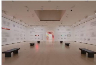
شكل فاسيلي كاندينسكي Kandinsky Vasily

- ومن المتاحف التقليدية التى أستخدمت البيئات الافتراضيه للتواصل عن بعد من قبل المتلقين عبر شبكات الانترنت متحف غوغنهايم بلباو Bilbao Guggenheim 1997 ، الذي يقع فى أسبانيا ويشتمل المتحف على أعمال ومنشآت واسعة النطاق خاصة بمواقع محددة من قبل الفنانين المعاصرين، وإحتواء علي مجموعة مختارة من أعمال الفن الحديث، ويضم 300 قطعة من فنون القرن 20 من فن التكعيبيية إلى فن وسائل العالم الجديدة، وصمم المتحف صفحة ويب تعرض بإستمرار الاعمال الفنية المختلفة التى يضمها المتحف من العروض الدائمة والمتغيرة، كما موضح بشكل ( ) قاعة أعمال لوحات لفاسيلي كاندينسكي