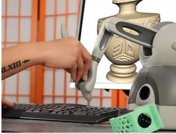
شكل يوضح جهاز تهيئة الواقع للمسّي Haptic device

جهاز الإحساس باللمس Phantom : يملك هذا الجهاز ثلاثة مفعلات (محركات كهربائية) دورها الرئيسي تحويل القوى المحسوبة إلى قوى حقيقية فعلية تطبق على يد المستخدم- يستطيع المستخدم الإحساس مثلا بليونة بالون منفوخ أو بصلاية حجر .