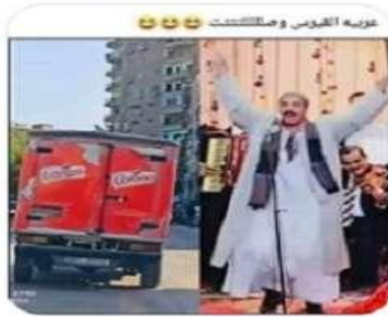
Like - Reply - 23m