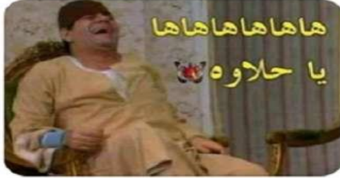
Like - Reply - 45m